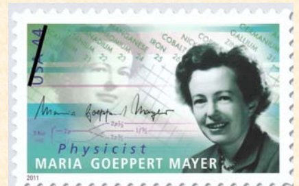
Wydany w czerwcu 2011 r. znaczek pocztowy upamiętniający Marię Goeppert-Mayer.