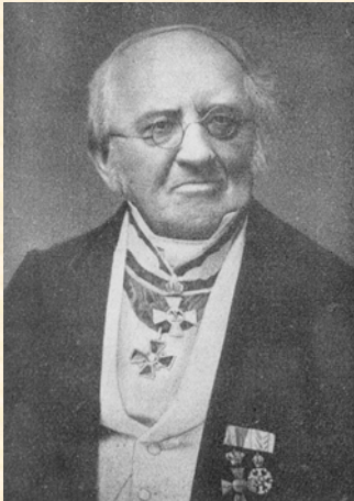
Heinrich Robert Göppert (1800–1884)