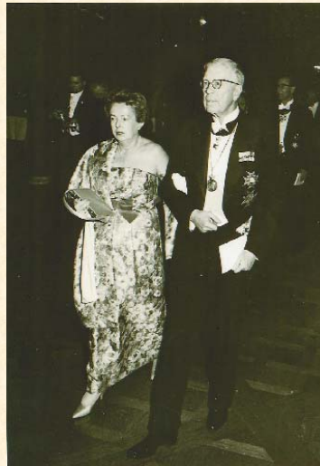
Maria Goeppert-Mayer z królem Szwecji podczas uroczystości wręczenia Nagrody Nobla, 10.12.1963.