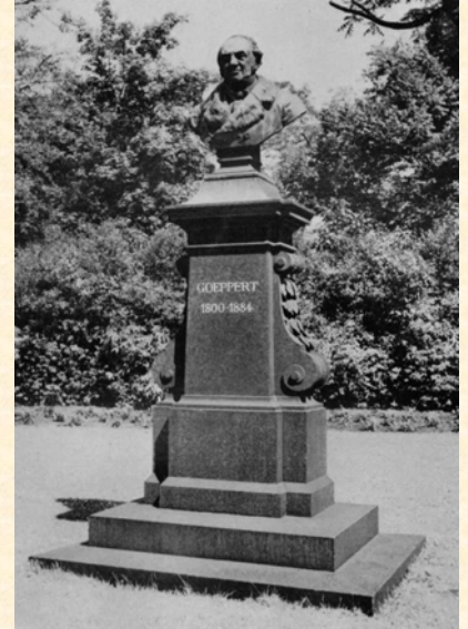
Dawny pomnik H.R. Göpperta autorstwa Fritza Schapera (1841–1919). Das ehemalige Denkmal für H.R. Göppert von Fritz Schaper (1841–1919).